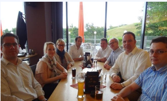
Ausklang in der Uni-Kneipe

Nach einem Schlenker vorbei am Rektoratsgebäude zu den Windrädern und einigen Worten zum Installationsprojekt „Metalicht“ ließ die Gruppe den Nachmittag gemütlich wie zu alten Studentenzeiten in der modernisierten Uni-Kneipe ausklingen.