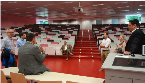
Der neue Hörsaal 33 in Gebäude K

Am 30.07 besuchten Alumni des Fachbereichs B ihre ehemalige Hochschule und erfuhren in einer vom Schumpeter School Alumni e. V. organisierten Führung, was sich alles an der Bergischen Universität verändert hat.